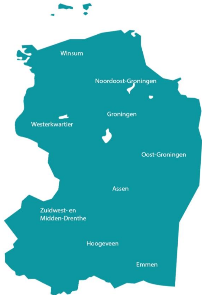
Ringen van de Classis Groningen-Drenthe

Classisindeling Protestantse Kerk in Nederland Bron: website Protestantse Kerk in Nederland ( www.pkn.nl )